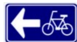
自転車一方通行規制の標識

このため、交通量が多く道幅が狭い道路の両側に専用レーンを設ける場合には、標識を掲げ、それぞれを一方通行にすることを計画している。違反した場合には、道交法の罰則が適用され、3カ月以下の懲役または5万円以下の罰金が科せられる。